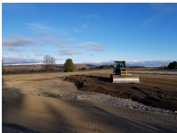
Ajout de sable pour le Ring de compétition et résultat final